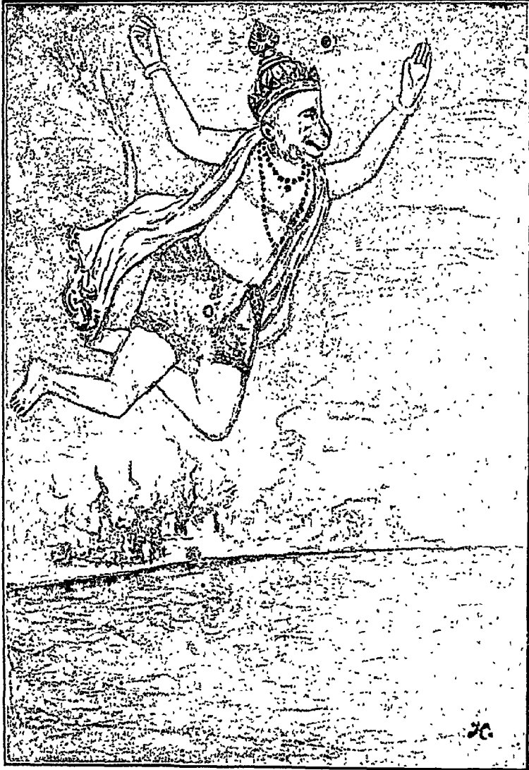
हनुमानजी का लंका दहन करना